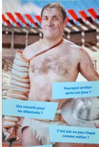
Marcus Attilus, gladiateur célèbre