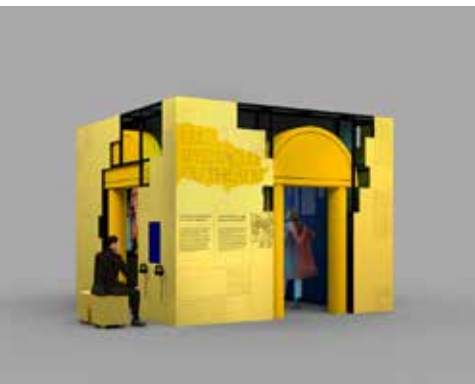
• Entrez au Théâtre !