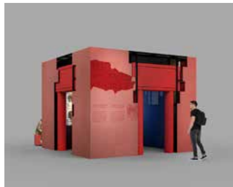
• Entrez au Cirque !