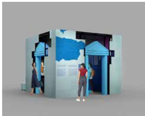
• Entrez à l'Amphithéâtre !