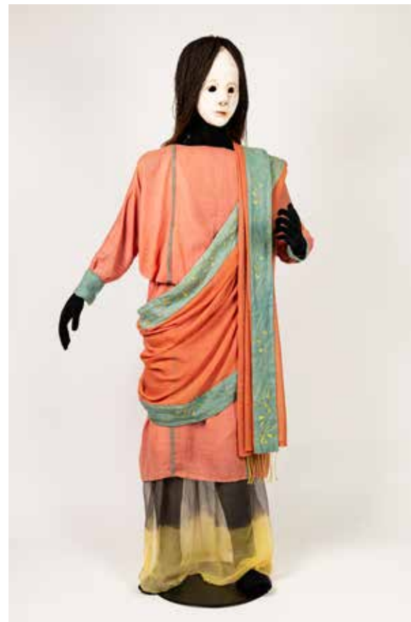
*Reconstitution d'un costume de pantomime romaine par le musée et sites archéologiques de Saint-Romain-en-Gal

Issu du terme grec « celui qui mime tout », la pantomime romaine a pour origine une pratique très ancienne d'imitation gestuelle. Elle semble être apparue en Grèce ou en Égypte hellénistique, puis s'est diffusée dans tout l'empire sous le règne d'Auguste (27 av.-14 apr. J.-C.). Seul sur scène, un danseur masqué mime un récit mythologique, accompagné d'un chœur ou de musicien. Cet art très populaire, rencontre un vif succès à travers tout l'Empire de par son caractère merveilleux et sa capacité à tout exprimer par le corps et la musique sans exiger une connaissance approfondie du latin ou du grec.